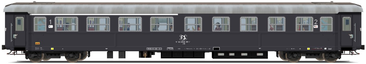
AcBcz 64302 (18 unità)